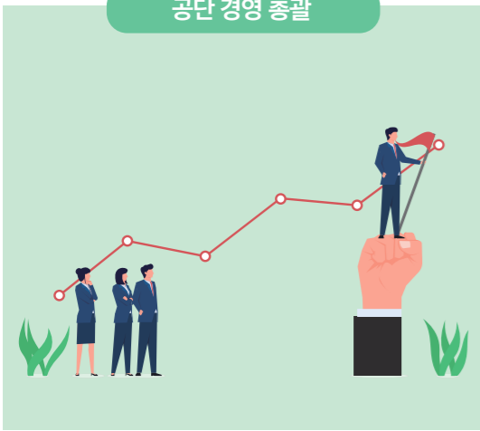
공단 경영 총괄

“지방공기업도 결국은 기업임을 늘 염두에 두고 탄탄한 재무구조 유지와 투명한 경영으로 시민에게 책임을 다하는 기관이 되겠습니다. 현장 파악과 SWOT[강점(strengths), 약점(weakness), 기회(opportunities), 위기(threats)] 분석을 통해 공단의 장·단점을 철저히 파악해서 체질을 강화하는데 역점을 두겠습니다. 아울러 공단 사업의 적정 영역을 다시 한 번 살펴보고 경영의 자율성과 전문성도 제고하도록 힘쓰겠습니다. 또 각종 시설 사용에 대해 시와 긴밀한 협조로 요금체계를 전면 검토해 불합리를 없애고 현실화시켜 경영합리화를 적극 추진해 나갈 것 입니다. 현재 관리하고 있는 시설 주변지역 주민들의 의견을 열린 자세로 청취하여 지역민들과 상생하는 방안을 마련하고, 내부적으로는 공단 노동조합과 직원들의 자발적인 참여로 지역경제 및 사회에 대한 공헌사업도 늘려 나가는 방안을 강구해 나가도록 하겠습니다.”